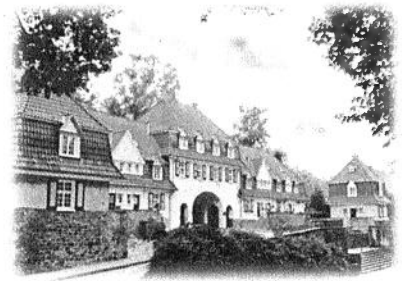
Museum am Brückenkopf

„Die Bürgerschaft Essen-Margarethenhöhe e.V.“ ● Am Brückenkopf 8 ● 45149 Essen ●